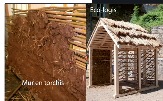
Mur en torchis

- Assemblage final des murs et de la toiture élaborés dans la journée.