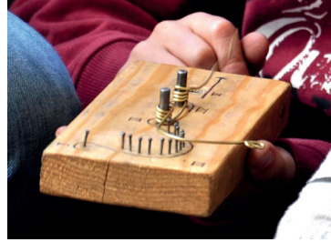
Fabrication d'une fibule

Activité qui permet aux élèves de fabriquer une lampe à huile à partir d'un moule ainsi qu'une fibule (broche), objets symboles de l'époque gallo-romaine, qu'ils emportent avec eux à la fin de la journée.